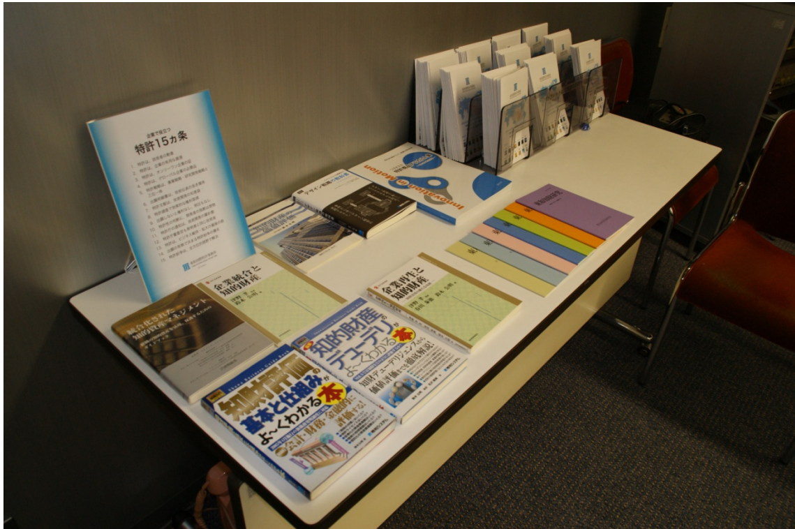
弊所関連書籍・パンフレット類の展示